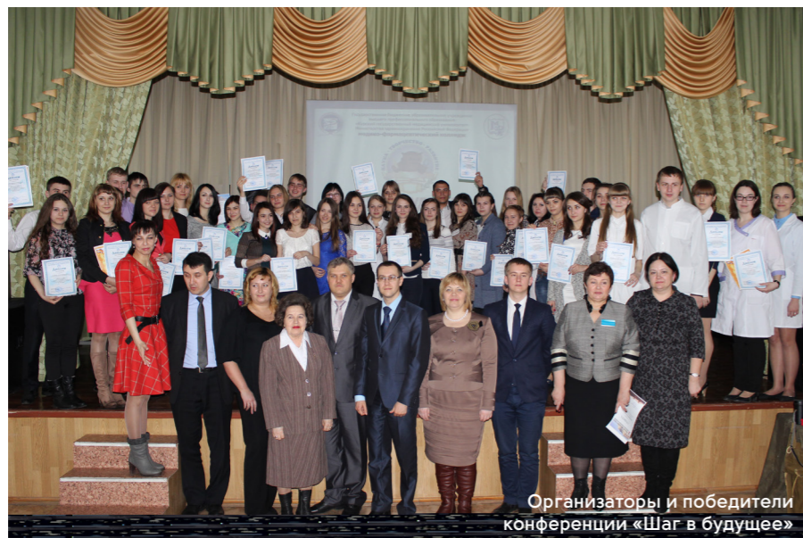
Организаторы и победители конференции «Шаг в будущее»

ется опыт совместной работы с научными кружками кафедр университета: фармацевтической технологии, микробиологии, фармакологии, гистологии, фармакогнозии. Проводятся совместные заседания кружков, обсуждаются темы исследований, осуществляется консультирование и совместное руководство научными студенческими работами и проектами. Это обеспечивает достижение интеграции различных подходов к решению научных проблем. В рамках деятельности научных кружков проводятся олимпиады, конкурсы, турниры знатоков, интеллектуальные игры (ежегодная «Самый