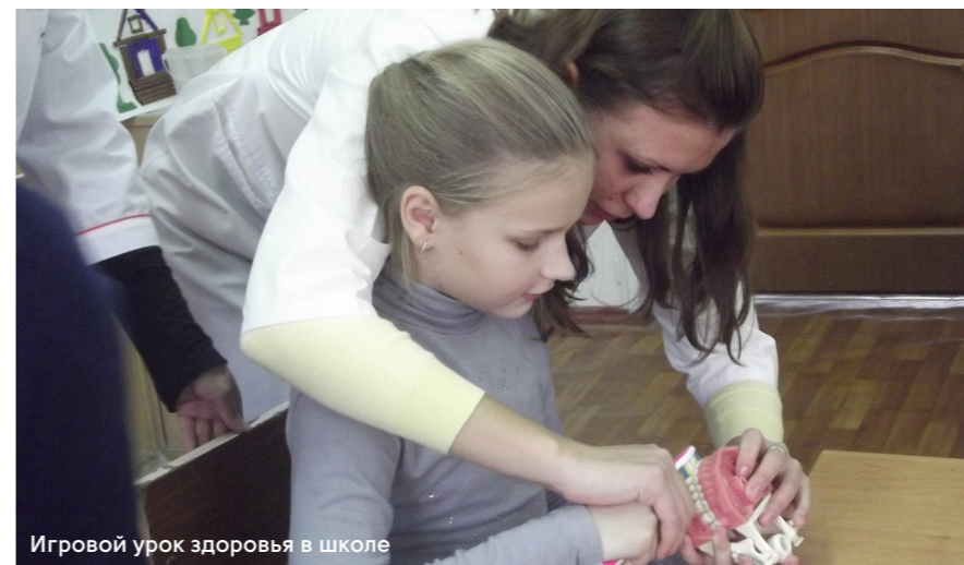
Игровой урок здоровья в школе

В. И. Скворцова, министр здравоохранения России