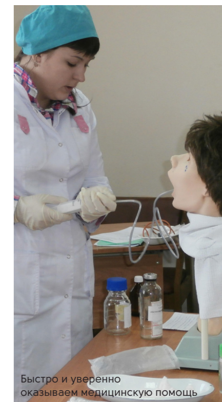
Быстро и уверенно оказываем медицинскую помощь

модулям. Традиционные совместные заседания студенческих научных кружков отделения лабораторной диагностики колледжа и кафедр фармакологии, гистологии, цитологии, эмбриологии, микробиологии, вирусологии, иммунологии КГМУ. Совместная работа студенческих научных кружков даёт студентам возможность глубже изучить дисциплину, способствует развитию навыков самостоятельной творческой работы, формированию профессионального мышления. Ежегодно лучшие научно-исследовательские работы представляются на Всероссийской научно-практической конференции студентов профессиональных образовательных организаций «Шаг в будущее», Всероссийской научной конференции студентов и молодых учёных с международным участием «Молодёжная наука и современность», Всероссийской научно-технической конференции в г. Железнодорожске.