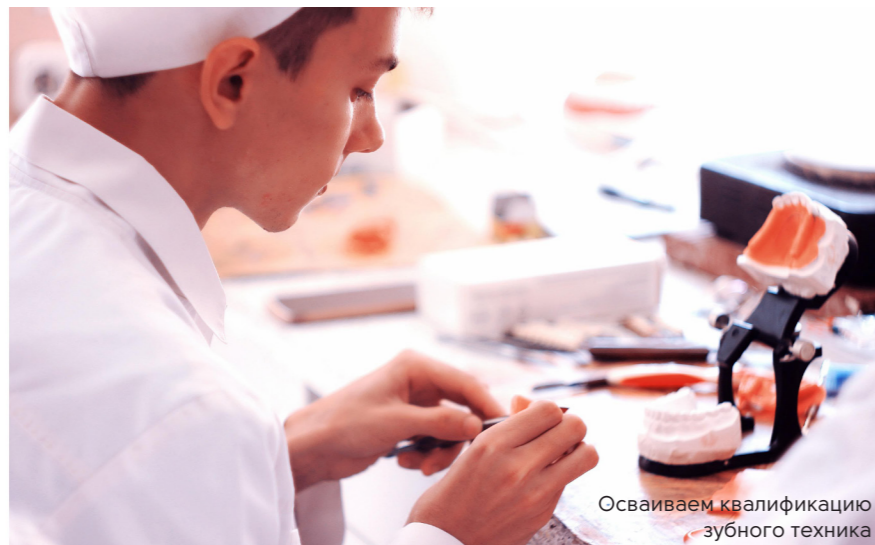
Осваиваем квалификацию зубного техника

Юбилей колледжа – яркая страница его жизни.