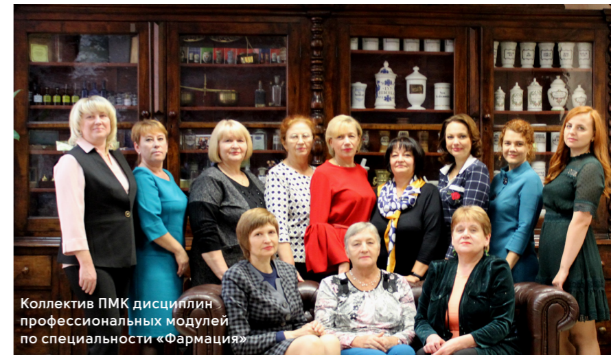
Коллектив ПМК дисциплин профессиональных модулей по специальности «Фармация»

Научная и учебно-методическая работа преподавателей ПМК