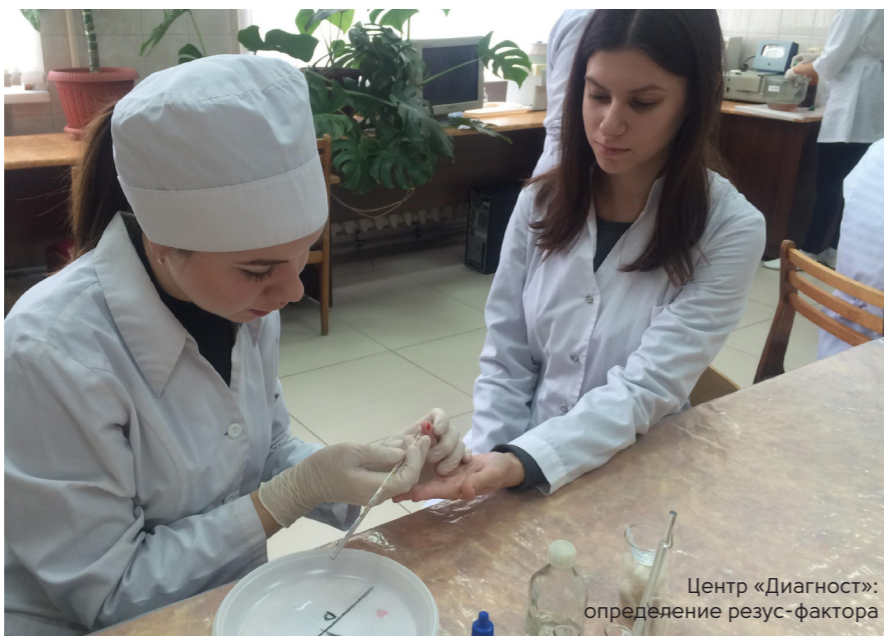
Центр «Диагност»: определение резус-фактора

студентов из Нигерии, которые успешно освоили специальность и получили диплом медицинского лабораторного технолога.