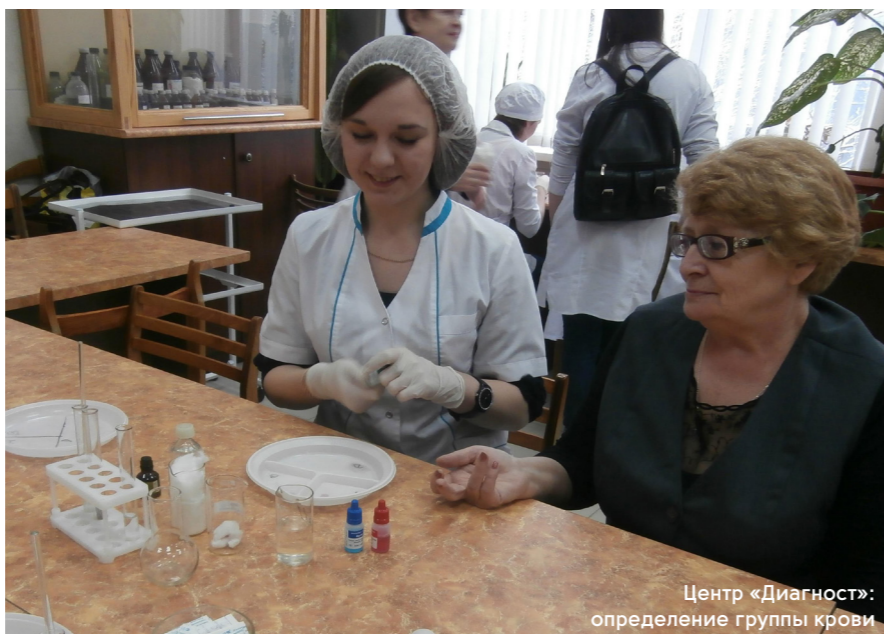
Центр «Диагност»: определение группы крови

В 2012 году факультет среднего профессионального образования КГМУ объединили с отделением лабораторной диагностики. На базе колледжа стали вести подготовку по специальностям «Лечебное