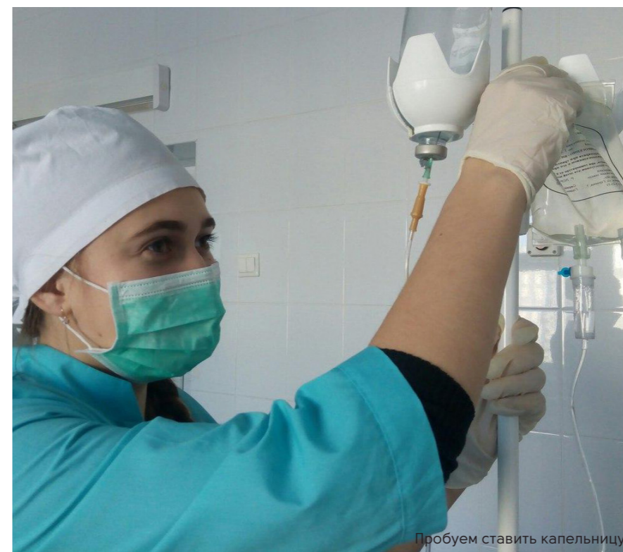
Пробуем ставить капельницу

Сегодня на отделениях работают 12 научных кружков, проводится 8 предметных олимпиад по разным дисциплинам и профессиональным