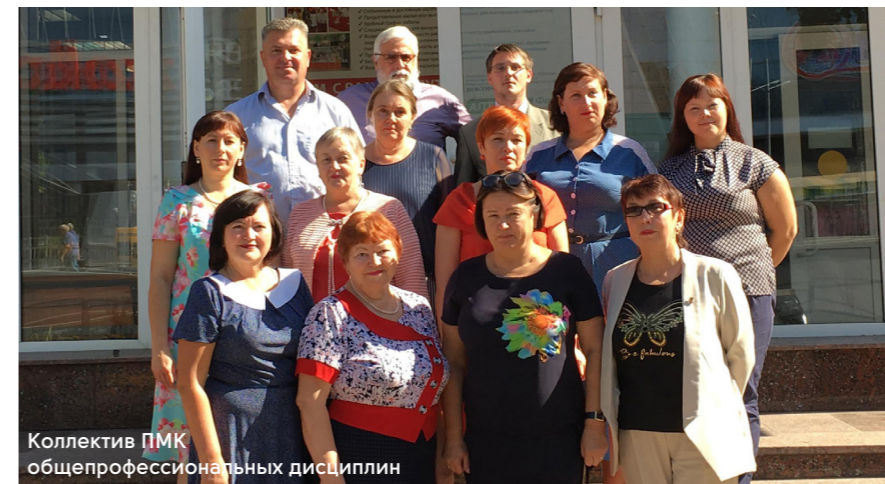
Коллектив ФМК общепрофессиональных дисциплин

Предметная методическая комиссия общепрофессиональных дисциплин объединяет преподавателей, которые ведут занятия на всех четырех отделениях колледжа.