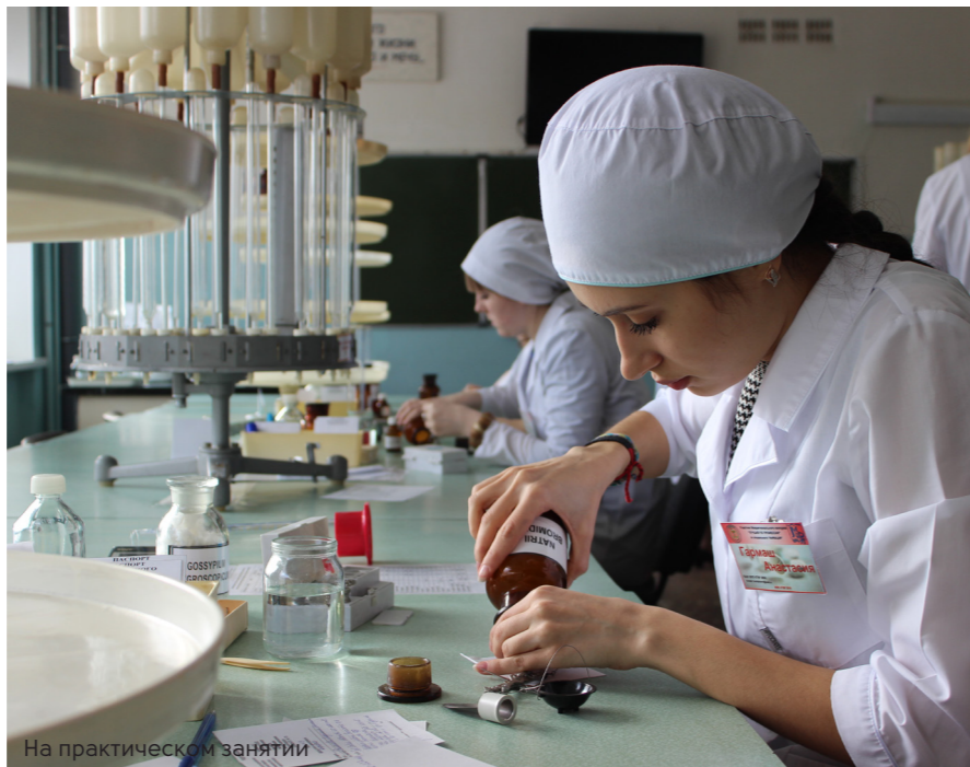
На практическом занятии

На сегодняшний день фармацевтическое отделение сотрудничает с многими аптечными сетями и индивидуальными предпринимателями, такими как ООО «Торговые дома Невис» (г. Санкт-Петербург), ООО «Курский аптечный склад», ОАО «Курская фармация», ООО «Ку-