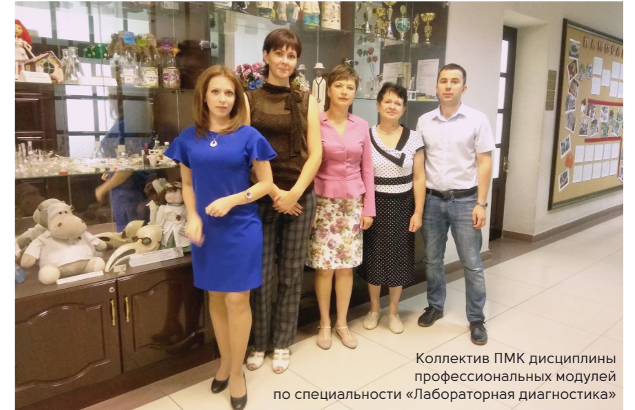
Коллектив ПМК дисциплин профессиональных модулей по специальности «Лабораторная диагностика»