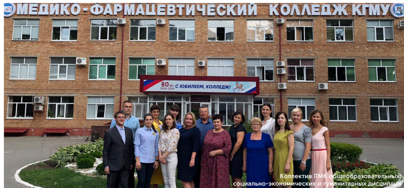
Коллектив ФМК общеобразовательных, социально-экономических и гуманитарных дисциплин

Большую роль в подготовке интеллектуально развитых компетентных специалистов, способных к активной творческой деятельности, играет предметная методическая комиссия общеобразовательных, социально-экономических и гуманитарных дисциплин. Предметы цикла уникальны по своему влиянию на формирование системы мышления молодых людей, воспитание важных для жизни в современном обществе таких качеств, как широта мировоззрения, патриотизм, высокая гражданская позиция, толерантность.